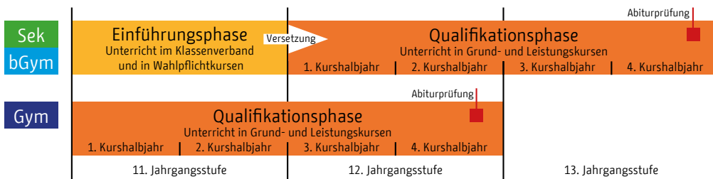
Abhängig von der Schulart dauert die gymnasiale Oberstufe zwei oder drei Jahre.

Für Bildungsgänge an Schulen besonderer pädagogischer Prägung müssen Sie mitunter zusätzliche Regelungen beachten, so beispielsweise an der Eliteschule des Sports und für die Züge im mathematisch-naturwissenschaftlichen Netzwerk.